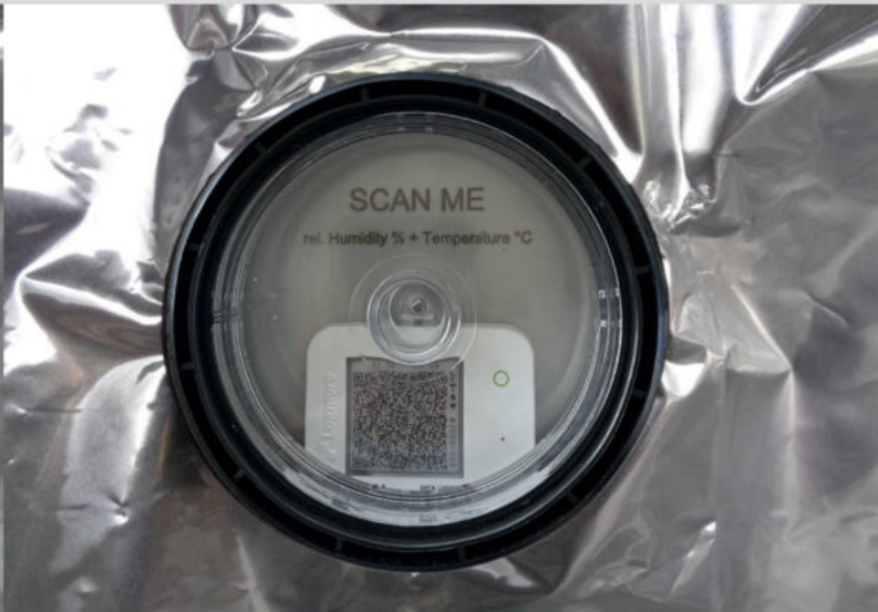
Mit dynamischem QR-Code